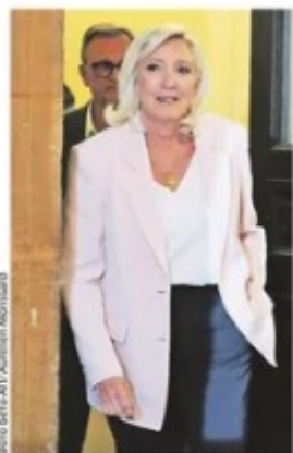
На излазу из суднице: Марин Ле Пен