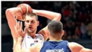
SRPSKE KOŠARKAŠE TEK ČEKA POSAO