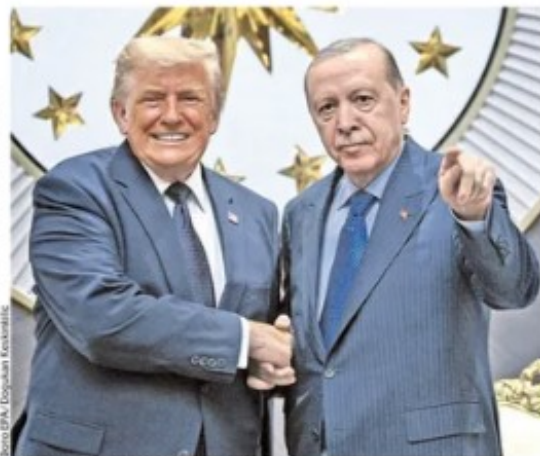
Доналд Трамп и Реџеп Тајип Ердоган