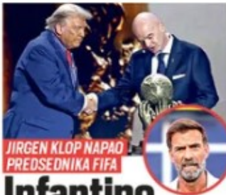
JIRGEN KLOPP NAPAO PRESEDNIKA FIFA