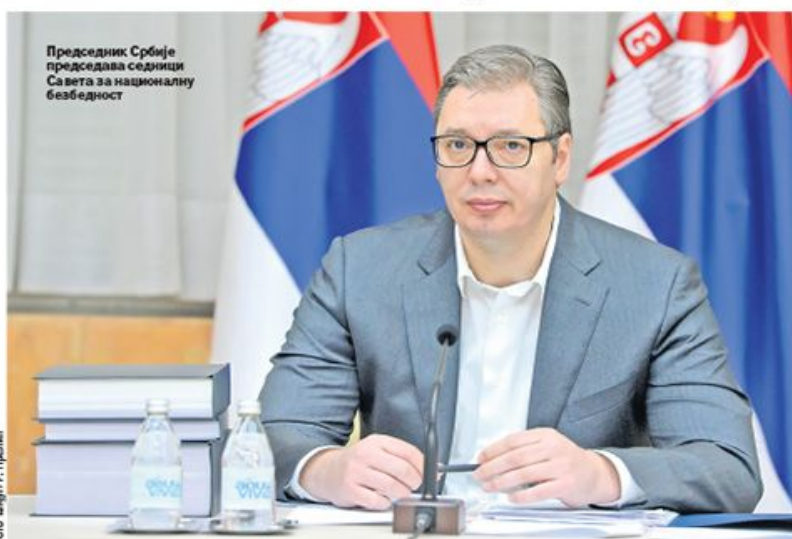
Председник Србије председава седници Савета за националну безбедност