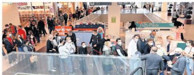
Дугачак ред за имунизацију јуче у „Ушће“