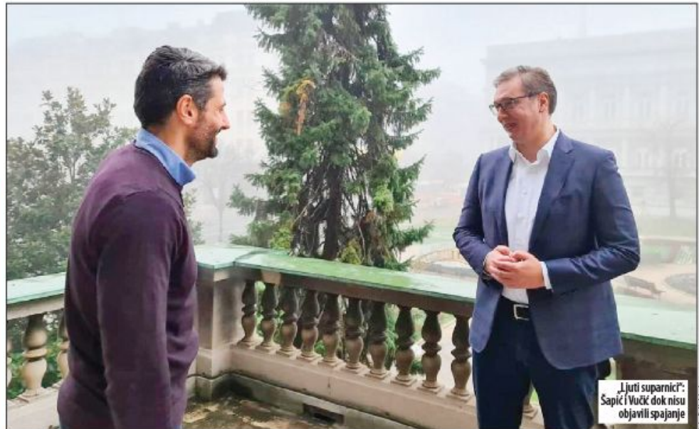
„Ljuti suparnici“: Šapić i Vučić dok nisu objavili spajanje