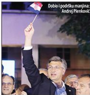
Dobio i podršku manjina: Andrej Plenković

Dan posle pobeде na izborima u Hrvatskoj