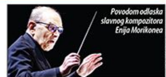
Povodom odlaska slavnog kompozitora Enja Morikonea