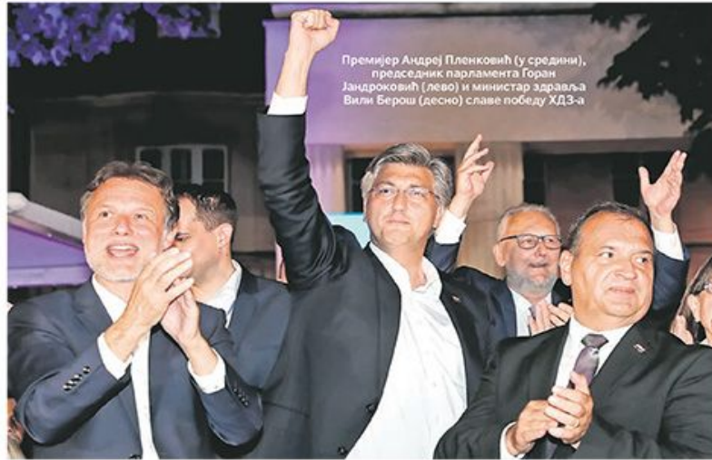
Премијер Андреј Пенковић (у средини), председник парламента Горан Јандрковић (лево) и министар здравља Вили Берш (десно) славе победу ХДЗ-а