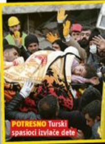
POTRESNO Turski spasioci izvlače dete