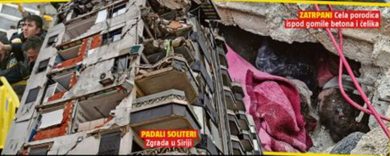
ZATRPANI Cela porodica ispod gomile betona i celika