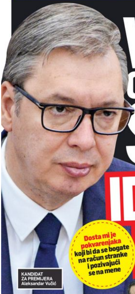
KANDIDAT ZA PREMIJERA Aleksandar Vučić

Dosta mi je pokvarenjaka koji bi da se bogate na račun stranke i pozivajući se na mene