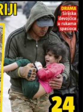
DRAMA Sirijska devojčica u rukama spasioca

24 SPASIOCA SRBIJA POSLALA U POMOĆ TURSKOJ