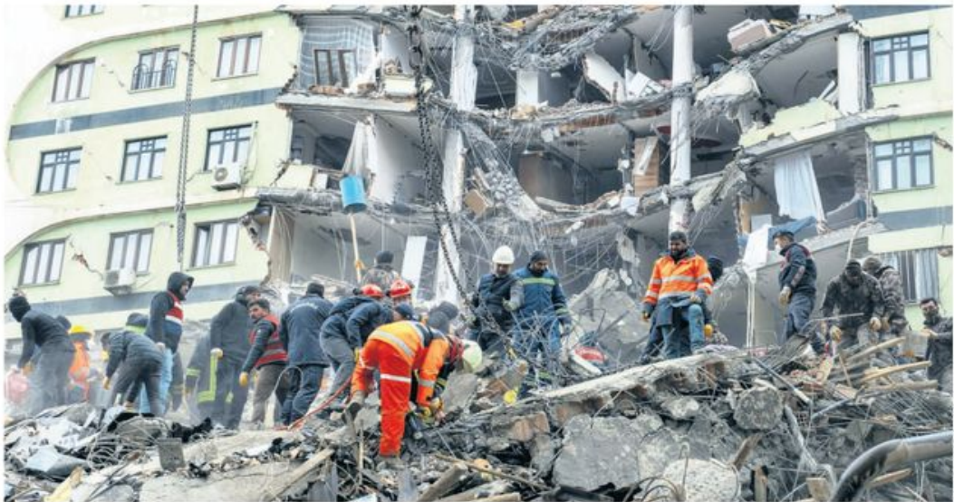
Потрага за преживелима у Дијарбакиру у југоисточном делу Турске