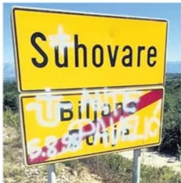
Нови графити мржње према Србима