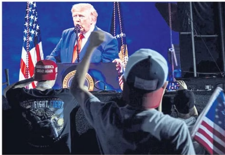
Обраћање председника САД у Националном тржном центру у Вашингтону