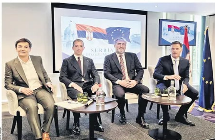
Председница Скупштине и министри Марко Ђурић, Немања Старовић и Синиша Мали на јучерашњем скупу

Догађај под називом „Serbia's Reform Moment: From Commitment to Delivery“, посвећен представљању резултата реформског процеса и напретка који је Србија остварила на путу ка чланству у Европској унији, одржан је јуче у Бриселу. Нашу земљу су на скупу представљали председница Народне скупштине Ана Брнабић, први потпредседник Владе и министар финансија Синиша Мали, министар спољних послова Марко Ђурић и министар за европске интеграције Немања Старовић. Брна-