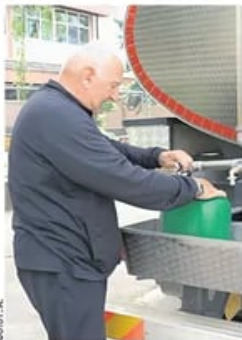
Цистерне са водом у Чачку

Угроженим општинама 165.000 литара флаширане воде