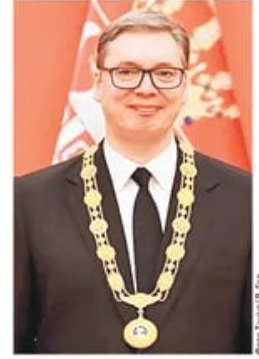
ПОЛИТИЧКА И МЕДИЈСКА ХИСТЕРИЈА ЗБОГ ПОСЕТЕ КИНИ

На њему су инсталирани значајни противваздухопловни системи, оклопне јединице и обалска одбрана. То је и допринело да острво добије познели назив – носач авиона усред Балтика. страница 3