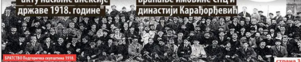
БРАТСТВО Подгоричка скупштина 1918.

■ Правда се да је тим чином дао основ за враћање имовине СПЦ и династији Карађорђевић