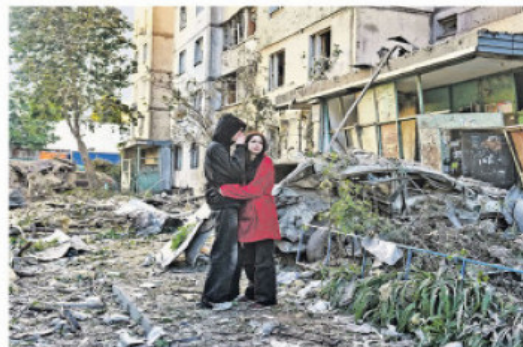
После удара пројектила у стамбену зграду у главном граду Украјине