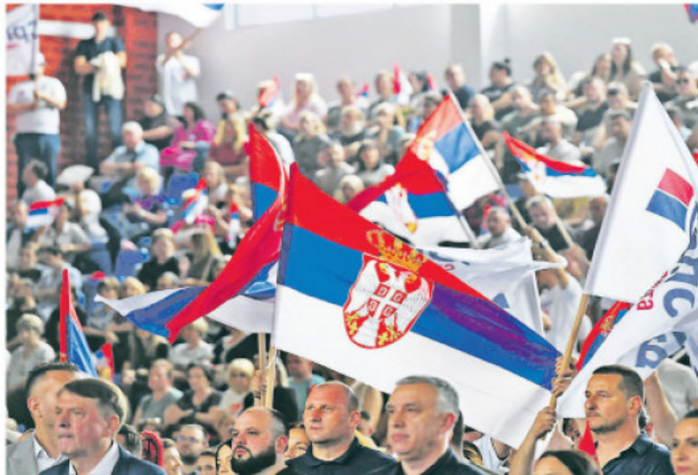
Предизборни скуп Српске листе у Звечану прошле недеље