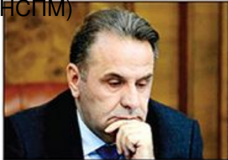
Rasim Ljajić, ministar u Vladi Srbije

Opozicija iz Beograda krizu koristi za napad na Vučića