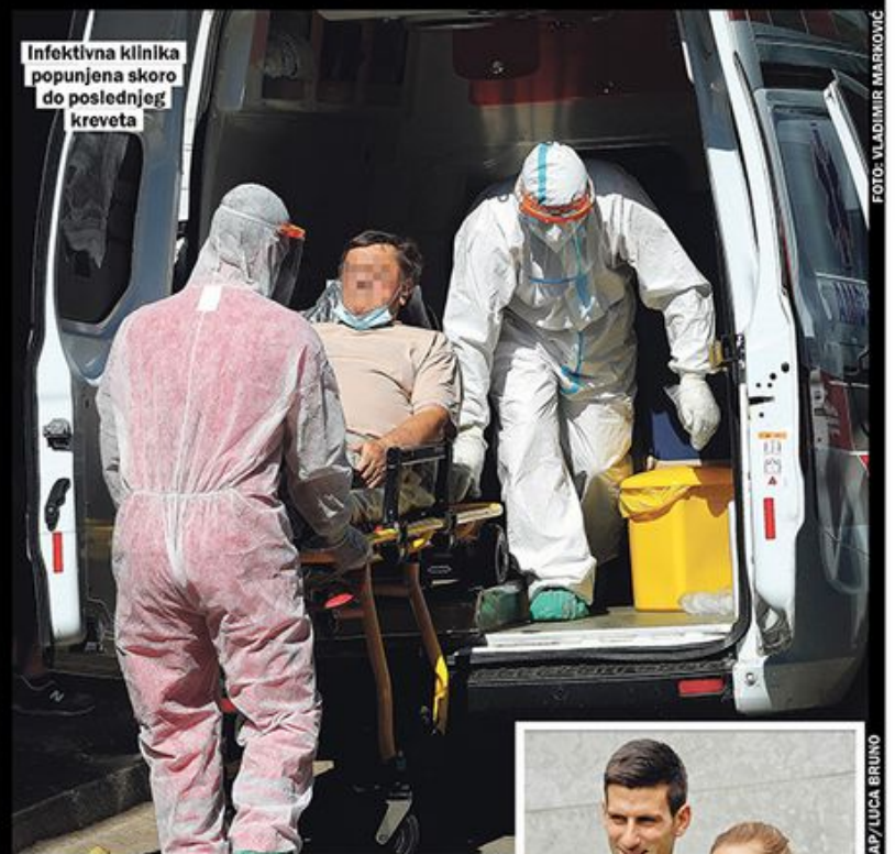
Infektivna klinika popunjena skoro do poslednjeg kreveta