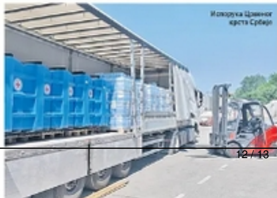
Испорука Црвенког крста Србије

Да се догодило Трамп није „залетео“ у претњи Оману, извештавају изворима посреднику између Вашингтона и Тегерана, свесни и чињеница да је Стејт департмент баш тај део излагања шефа Беле куће поставио на свој званични