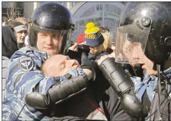
Srpski premijer je doveo u vezu proteste u prestonicama Rusije i Srbije: Demonstracije opozicije u Moskvi