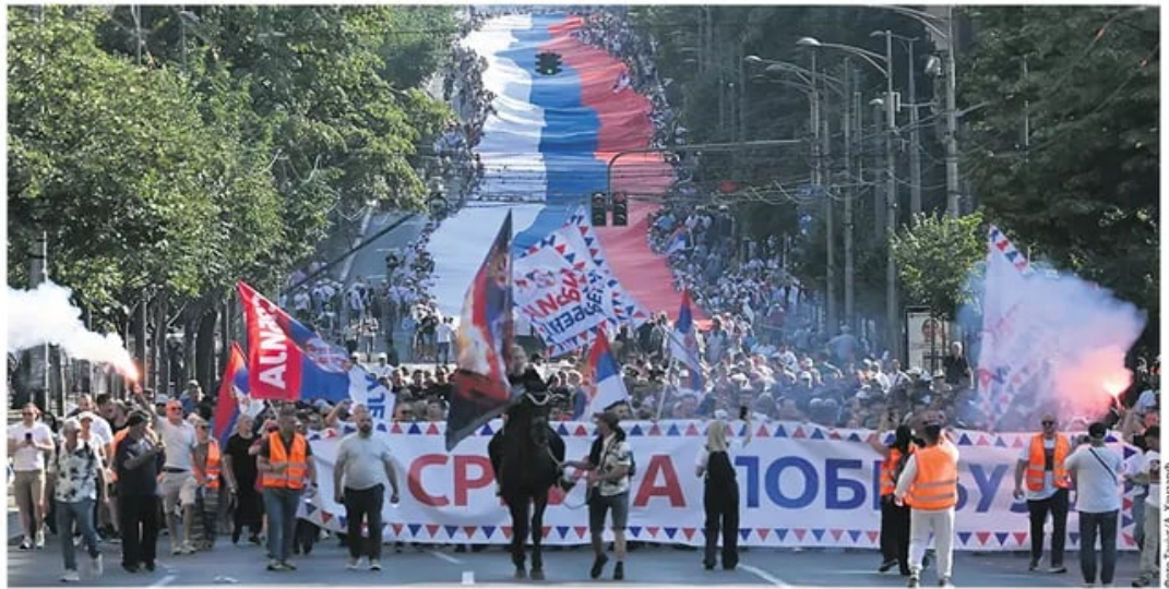
Фото: Београд, Александар