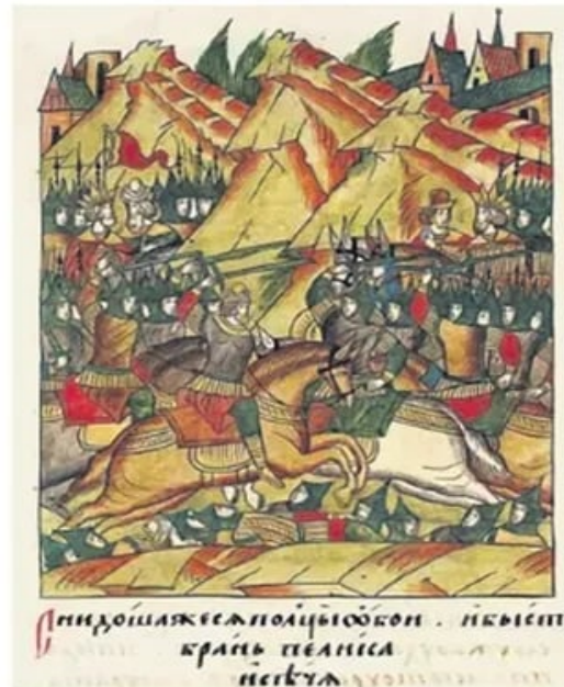
Бој на Косову, руска минијатура из 16. века