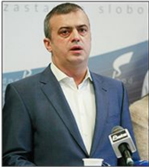
Autorski tekst Sergeja Trifunovića, lidera PSG, povodom prvih godinu dana u politici