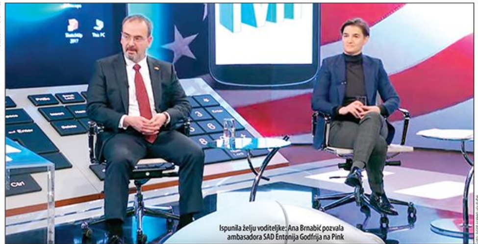
Ispunila želju voditeljke: Ana Brnabić pozvala ambasadora SAD Antonija Godfrija na Pink