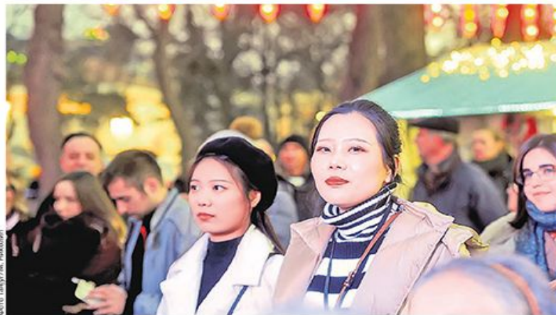
Дочек Кинеске нове године у Београду, на Калемегдану у петак 24. јануара

Сезонски грип и коронавирус имају сличну клиничку слику, само лабораторијски тестови могу да покажу о каквој инфекцији је реч