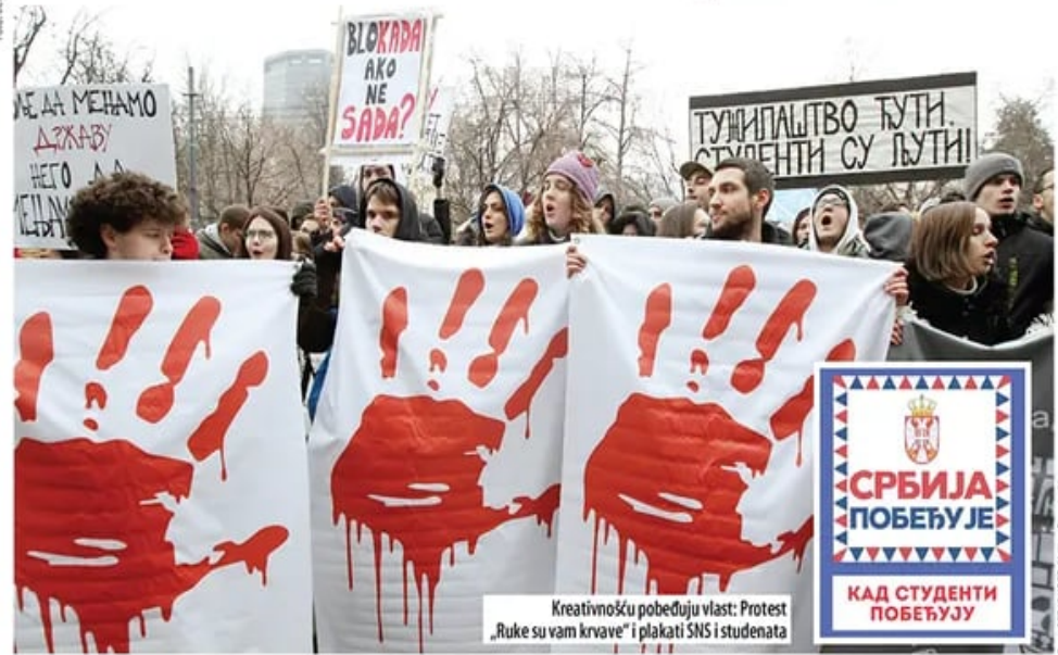
Kreativnošću pobeđuju vlast: Protest „Ruke su vam krvave“ i plakati SNS i studenata