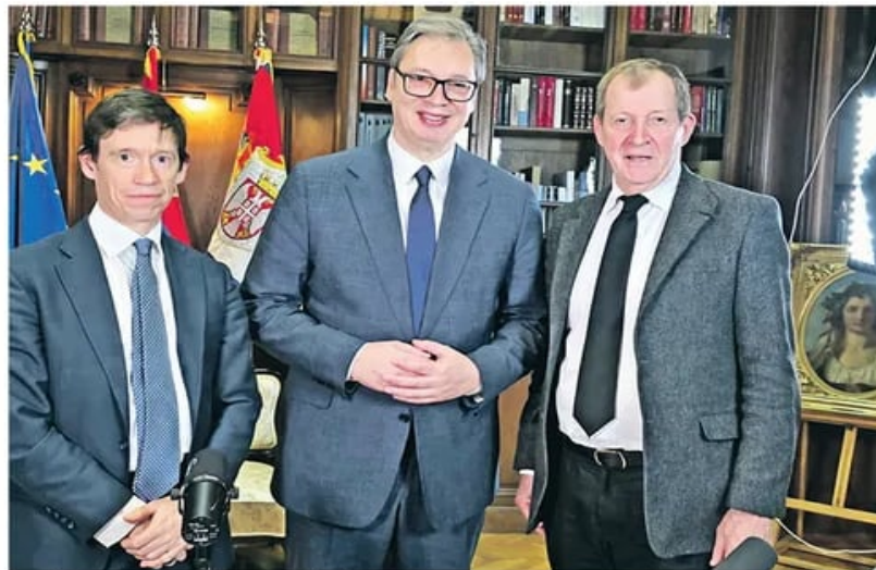
Рори Стјуарт, Александар Вучић и Алистер Кембел

Председник Александар Вучић изјавио је да будућност Србије види у отварању граница на Балкану и с Европом. У интервјуу за подкаст Алистера Кембела „Остало је политика“ на платформи „Епла“, на питање како гледа на 1999. рекао је да су људи веома разочарани оним што је урађено. „Ако питате грађане Србије, осећају још већу огорченост и разочарање због понашања 19 земаља које су покренуле агресију против суверене земље. И људи су апсолутно сигурни да је то учињено без сагласности УН, што је и потврђено Резолуцијом 1244. То није учињено да би се спречила некаква хуманитарна криза, како