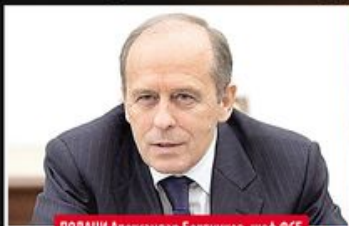
ПОДАЦИ Александар Бортников, шеф ФСБ