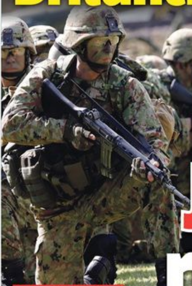
IPAK NE MOGU NA SILU Britanija ima veliki broj vojnika na Kosovu