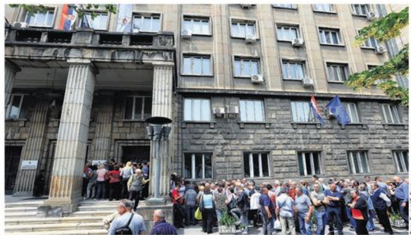
Бирачко место у просторијама Конзуларног уреда амбасаде Републике Хрватске у Београду, у Улици кнеза Милоша

У том меморандуму наведено је да би Санџак са специјалним статусом имао своју скупштину, гувернера, владу, полицију, судство и да би био децентрализован, да би обухватао девет општина у Србији (Нови Пазар, Тутин, Сјеницу, Пријеполу, Прибој и Нову Варош) и пет општина у Црној Гори. Границе би му чувале међународне снаге, а спорове са суседним државама решавао би Међународни суд за бившу Југославију. страница 5