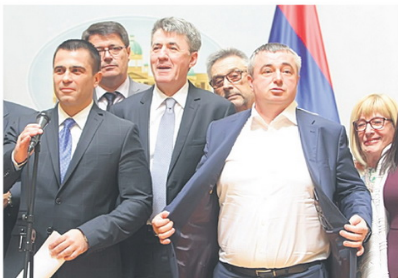
Рат изјавама: посланици СПС-а јуче у парламенту

Део опозиције бојкотовао седницу, оптужујући Мају Гојковић да спречава њихове предлоге, док она одговара да су фалсификовали допуне дневног реда, уз притиске на запослене у писарници