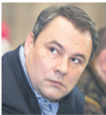
Званично је глава чувене грофовске породице Толстој