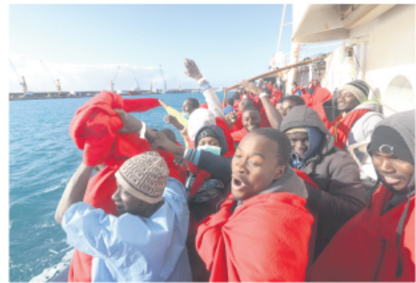
Више од милион избеглица с Блиског истока и из Африке се 2015. године домогло „фамилије“, махом преко Балкана

Дахла (Мароко) — Више од 180.000 Италијана напустило је лане доминату, да своју будућност траже негде другде. У економску миграцију, трбухом за крухом, ти Италијани отишли су легално, с пасошима. Када исти такав покрет — из оскудице и економског безања, ка замислиеном бољем животу — учине хиљаде Африканаца, на Медитерану и широм Европе диже се узбуна. Туђи ратни боловама распоређују се ка јужним обалама Средоземља, стручањаци за затварање граница нуде се у Сахари, док се Европљани код куће опасују зидовима као у средњем веку. Зашто Европљани могу тако лако задику снагу и траже нове животне адресе, а Африканцима се иста могућност ускраћује на свакојак, па и бруталне начине? Како је таква дискриминација могућа у 21. веку — питао се прошле суботе учесник међународне дебате у Дахли, на југу Марока, током трећег Кран Монтана форума о Африци.