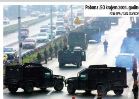
Pobuna JSO krajem 2001. godine

Oslobađanje sedmorice pripadnika rasformirane JSO za jedne kontinuitet sa devedesetim, za druge trijumf prava