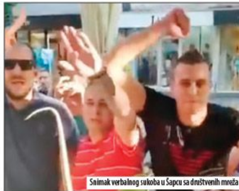
Snimak verbalnog sukoba u Šapcu sa društvenih mreža

U ponedeljak je grupa mladića ispred Kulturnog centra verbalno vređala Dragana Đilasa i njegove sarad-