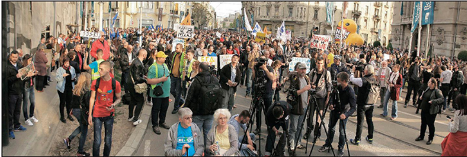
„Protest protiv diktature“ zajedno sa demonstrantima Inicijative „Ne da(vi)mo Beograd“ koji su se okupili povodom godišnjice kriminalnog rušenja u Hercegovačkoj ulici