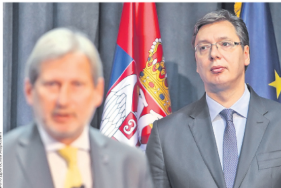
Јоханес Хан и Александар Вучић

Невероватан је степен агресије који се чује и осећа из изјава Албанаца, а посебно према ЕУ, оценио премијер