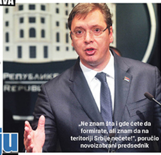
„Ne znam šta i gde ćete da formirate, ali znam da na teritoriji Srbije pešate!“ poručio novoizabrani predsednik