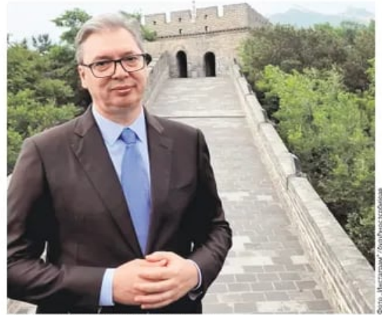
Александар Вучић у обиласку Кинеског зида