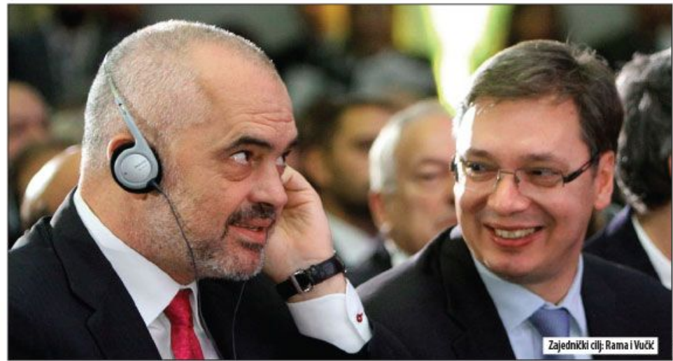
Zajednički cilj: Rama i Vučić