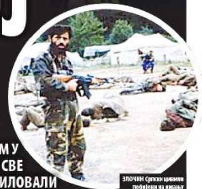
ЗЛОЧИН Српски шовени побијени на ивици Растипа у БиХ 1995.