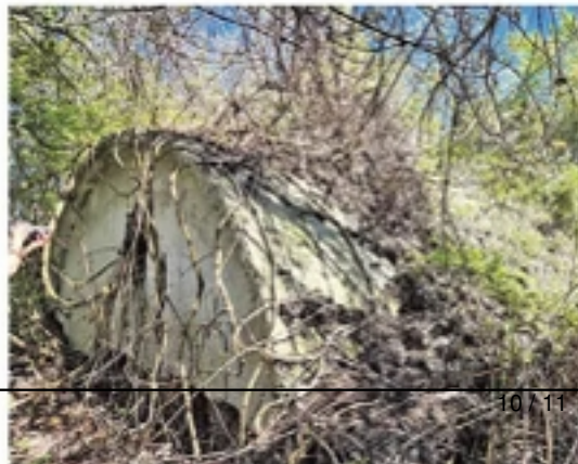
Поредина Црква Светог архидјакона Стефана у Доњем Неродимљу