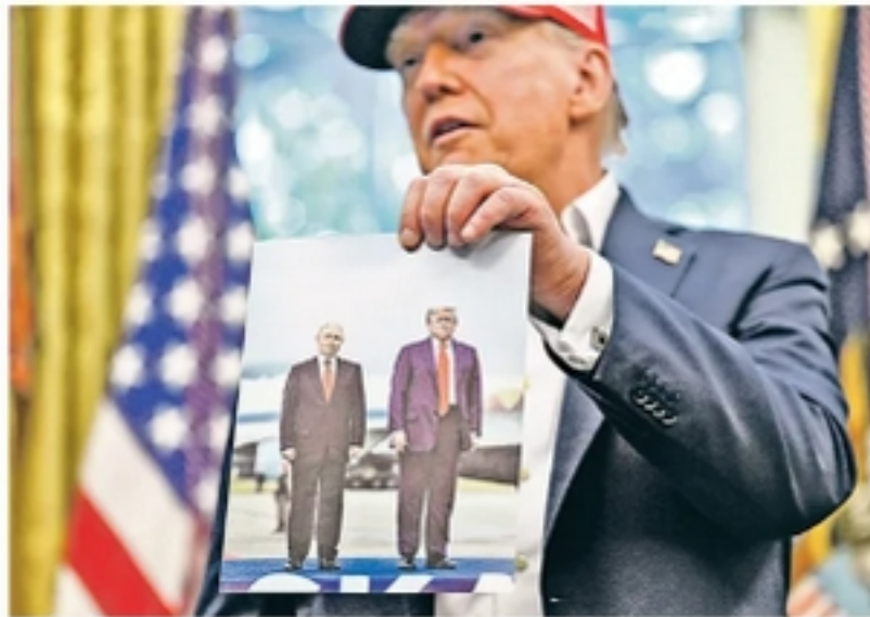
Председник САД се отворено поноси својим односом са Владимиром Путином; у његовом кабинету прошле године