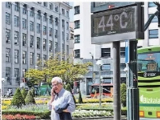
Јуче су у шпанском граду Билбао забележили 44 степена