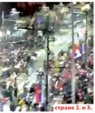
странице 2. и 3.

СМИШЉЕНО УМНОЖАВАЊЕ НЕИСТИНЕ Звучни топ као службена лаж заведена у актима ЕУ