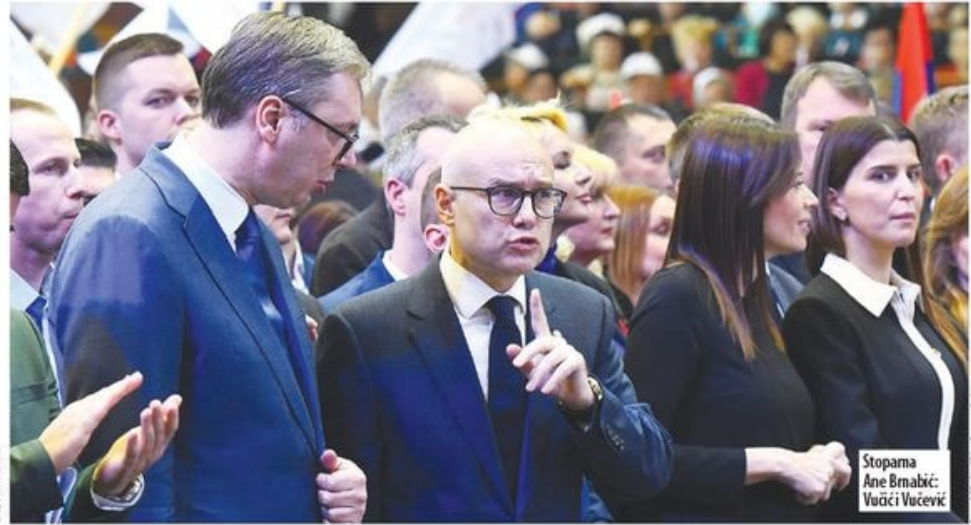
Stopama Ane Brnabić: Vučići Vučići