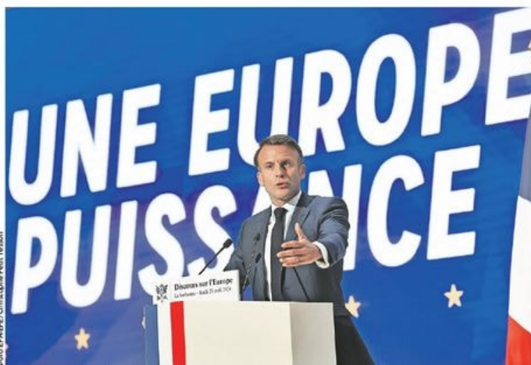
Медијски садржаји које гледају деца и адолесценти у ЕУ све више су „амерички и азијски“: француски председник

Русији се не сме дозволити да победи у Украјини, морамо да изградимо стратешки концепт кредибилне одбране