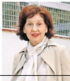
Гордана Сиљановска Давкова

Скопље – У првом кругу председничких избора у Северној Македонији кандидат ВМРО-ДПМНЕ Гордана Сиљановска Давкова освојила је 40,08 одсто, док је актуелни председник Стево Пендаровски освојио 19,93 одсто популарности, саопштилa је Државна изборна комисија. Њих двоје ће снаге одмерити у другом кругу председничких избора 8. маја, за када су заказани и парламентарни избори. страница 4