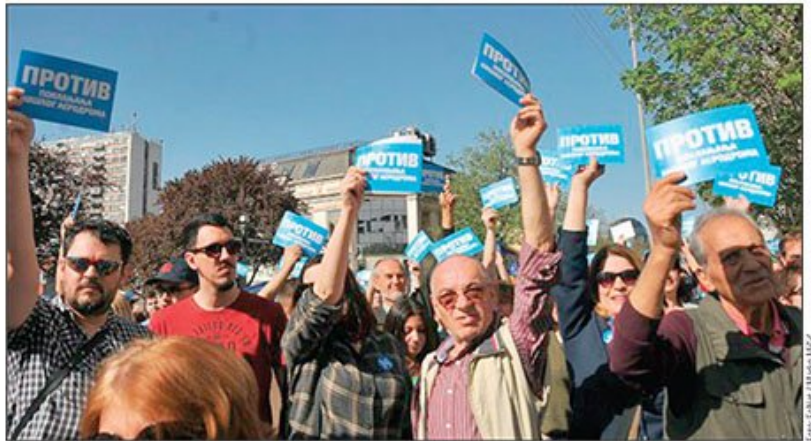
Opozicija u Nišu najavilo je da će u vreme posete Vučića obilaziti gradsku i opštinske uprave i javna preduzeća: Raniji protest Nišlija

Gradski odbor SNS-a prethodno je saopštio da Vučić dolazi kako bi prisu-