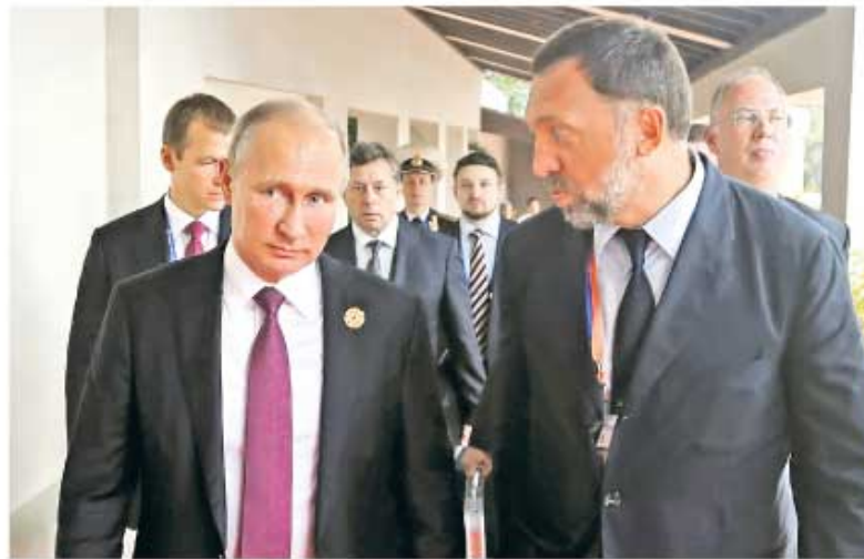
Владимир Путин и Олег Дерипаска

САД ће укинути санкције „Русалу“, водећем светском произвођачу алуминијума, уколико Олег Дерипаска прода свој удео од 48 одсто