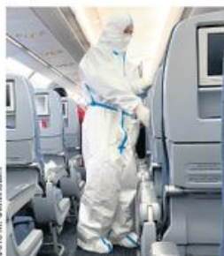
Кабинско особље у авиону за Пекинг

Пуне три недеље није било изласка из собе хотела који је предвиђен за изолацију оних који улазе у Кину. На вратима сензори, у ходницима камере