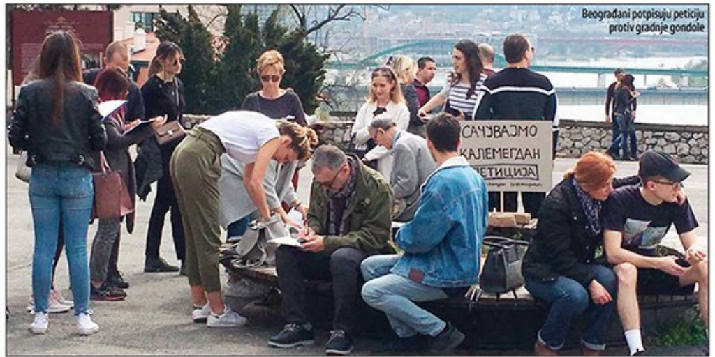
Beograđani potpisuju peticiju protiv gradnje gondole