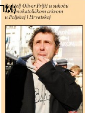
Poljski Oliver Frlić u sukobu s katoličkom crkvom u Poljskoj i Hrvatskoj