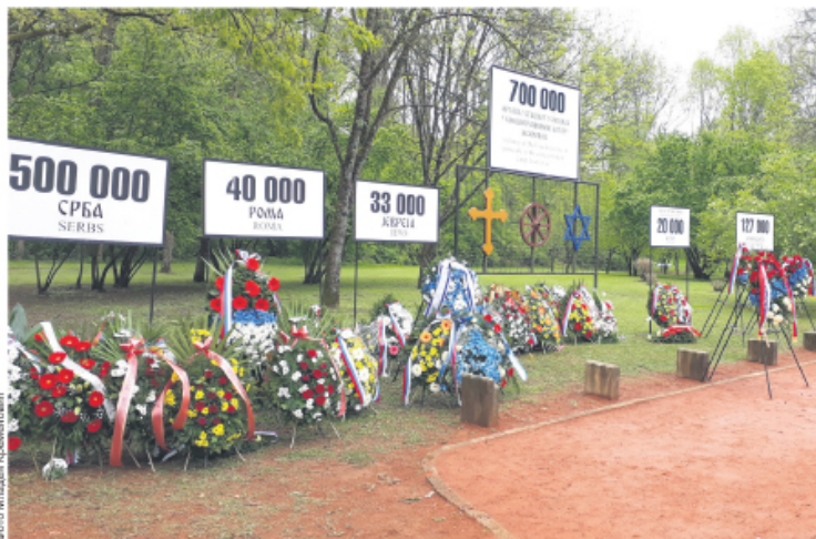
Доња Градина: једно од највећих стратишта на Балкану у Другом светском рату

Ниси постао бољи зато што огромног броја Срба више нема – напротив. И нећеш бити више од просечног док свом злу не погледаш у лице и осетиш стид, поручио премијер Александар Вучић