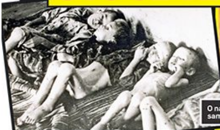
O najvećem zločinu samo jedna rečenica

...u zavisnom sreću z... ...oko hiljada ljudi. Samo u toku jedne noći ...tame su u Pivskoj prišli ubice preko hiljadu Srba. Istih meseci i meseci osnovani su i prvi koncentracijski logori, među kojima i najzloglas- tiji - Jasenovac. Masovni pogromi bili su jedan od tri na- čina na koji su ustave planirale da reše pro- blema oko dva miliona Srba na te-