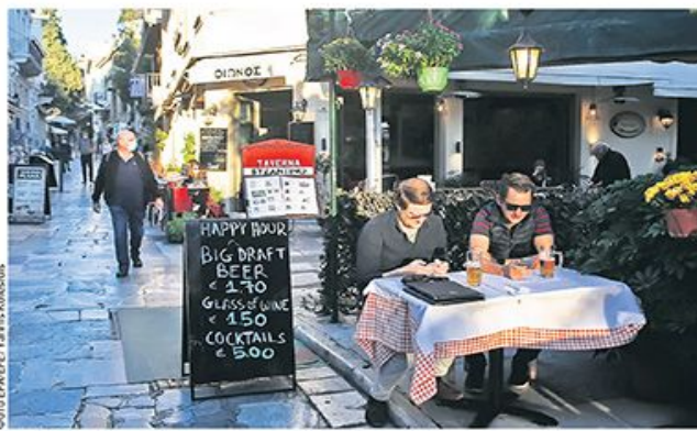
Од нашег дописника Јасмина Павковић Стаменић