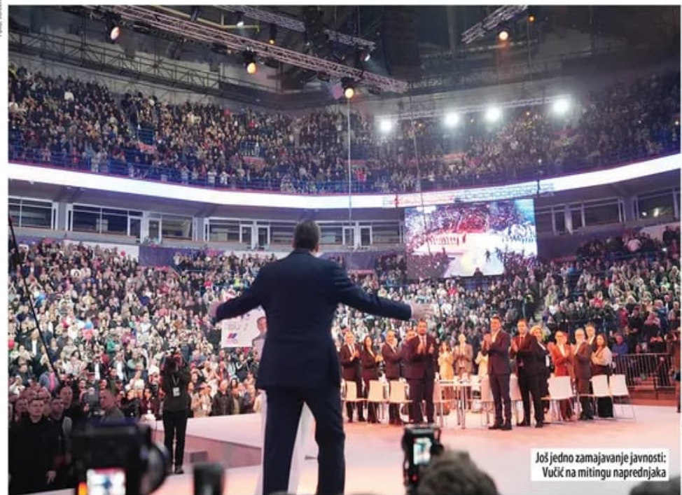
Još jedno zamajavanje javnosti: Vučić na mitingu naprednjaka