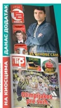
НА КИОСЦИМА ДАНАС ДОДАТАК