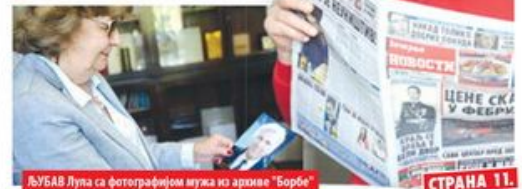
ЉУБАВ Лупа са фотографијом мужа из архиве "Борбе"