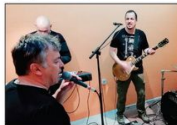
Reporter Danasa na Karajlićevoj probi pred koncert na beogradskom Tašmajdanu 25. maja