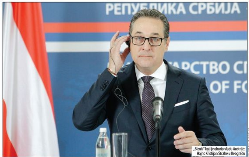
„Biznis“ koji je oborio vladu Austrije: Hajnc Kristijan Štrahe u Beogradu

Mendi Mening, učiteljica godine u Sjedinjenim Državama za 2018, za Danas Strah dece od deportacije iz Amerike je veoma realan Strane 16-17