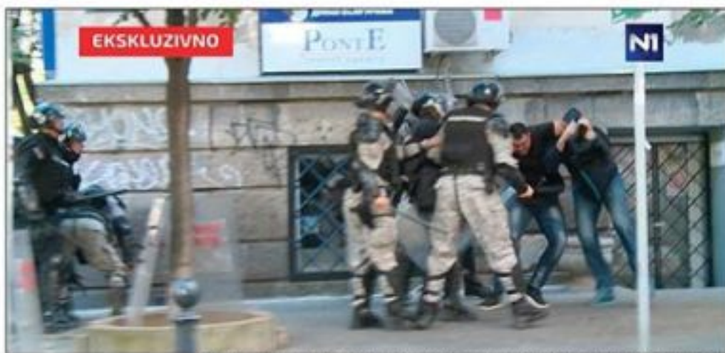
Predsednik reagovao na ukidanje presude žandarmima zbog fizičkog napada na njegovog brata. Incident tokom Parade ponosa 2014.