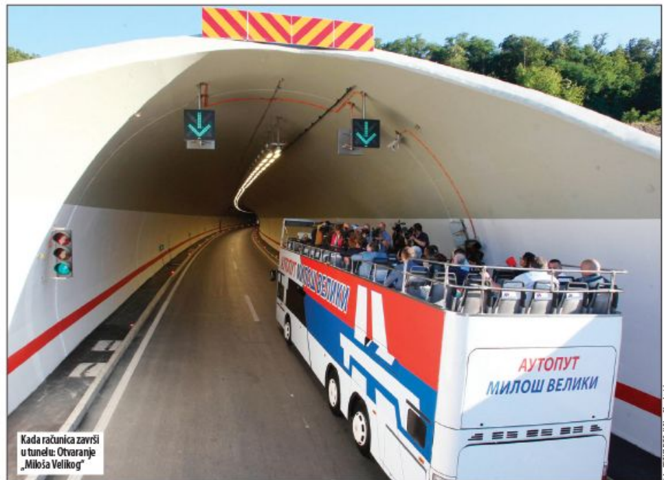
Kada računica završi u tunelu: Otvoranje „Miloša Velikog“