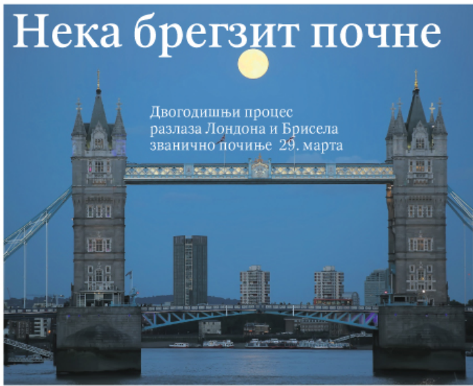
Сунрак изнад Тауер бриџа у Лондону

Рејтинг агенција „Мудис“ обрдовала нас је већу да нашу економију слика светлијим бојама. Повећала је кредитни рејтинг Србије за дугорочно задужевање у домаћој и страниј валути са „Б1“ на „Бб3“ са „стабилним“ изгледима за даље побољшање. Према оцени агенције, повећању рејтинга допринели су остварени резултати фискалне консолидације, примена структурних реформи, бољи од очекиваних изгледи економског раста и обезбеђена ценовна стабилност, као и унапређење институционалног оквира и напредак у преговорима са Европском унијом. страница 11