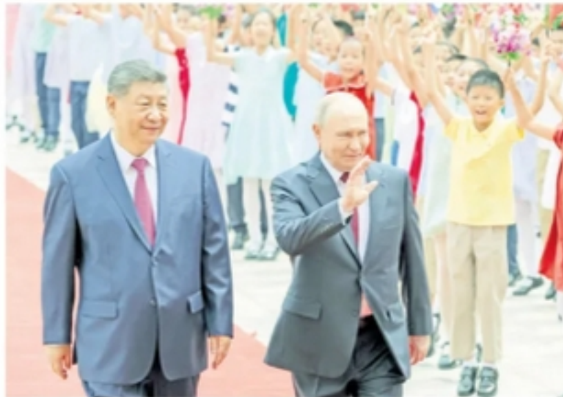
На сценином телеску у Пекингу