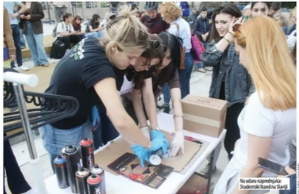
Na učano naprednjaka: Studentski štand na Slaviji