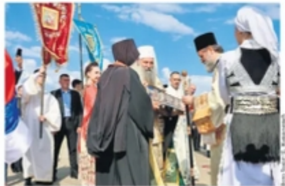
Свечани дочин на Аеродрому „Никола Тесла“