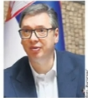
АЛЕКСАНДАР ВУЧИЋ НА СКУПУ „СВЕТ У СРБИЈИ“