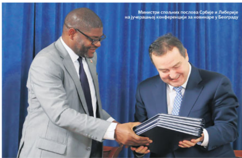
Министри спољних послова Србије и Либерерије на јучерашњој конференцији за новинаре у Београду