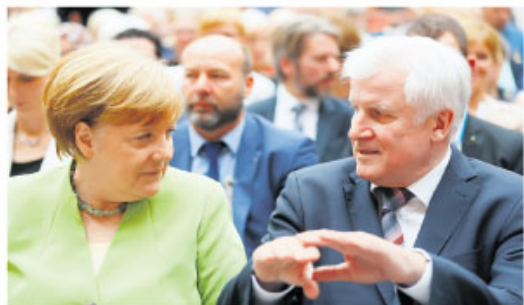
Ангела Меркел и Хорст Зехофер

Канцеларкина политика „отворених врата“ довела је до тога да је добила рок од две недеље да на самгит ЕУ крајем месеца обезбеди решење. Не верује се, међутим, да ће у супротном њен кабинет пасти, као што нема много вере ни да ће лидери у Бриселу бити у стању да мигрантско кретање