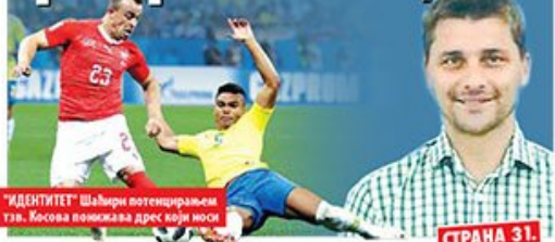
"ИДЕНТИТЕТ" Шаћери потенцијалем тзв. Косова помичава дрес који носи