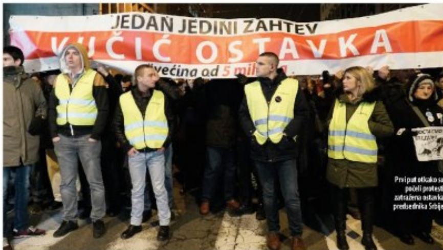
Prvi put otikako sa poceli protesti zahtevu ostavka predsednika Srbije