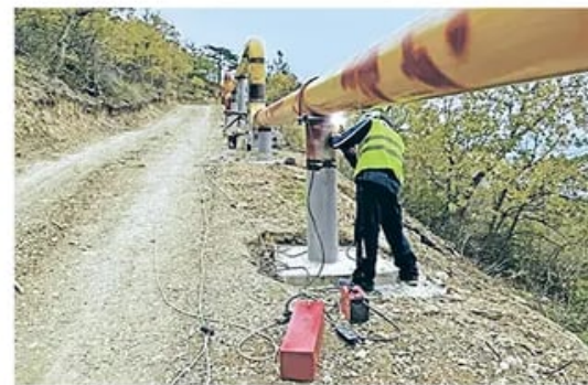
Од нашег сталног дописника Младен Кременовић

Бања Лука – Да ли би спорно питање расподеле такзване државне имовине, које већ две деценије изазива дубоке политичке потресе у Босни и Херцеговини, могло да буде решавано тихо, посредно и без формалног политичког договора, кроз инфраструктурне пројекте и уз утицај међународних актера, пре свега САД? Изградња два странетска гасовода кроз БиХ и став који су заузеле власти у Сарајеву у вези са тим пројектима узакону да би то питање могло да се решава на бази прагматизма.