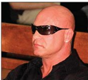
Udruženje žena Etno forum iz Svriljiga kritikovalo osuđujuću presudu za ubistvo Čuruvije

Autori projekta su bili isključeni iz radova Strana 5