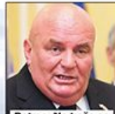
Palma: Ne kaže se seljak nego gospodin poljoprivrednik