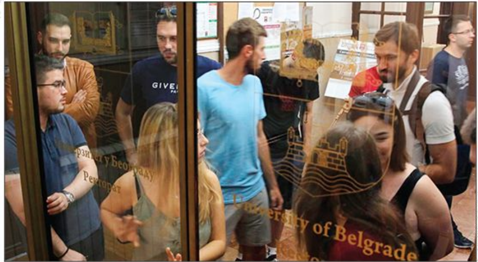
Za njihove časne namere stigla je podrška sindikata prosvetnih radnika „Nezavisnost“: Studenti u Rektoratu