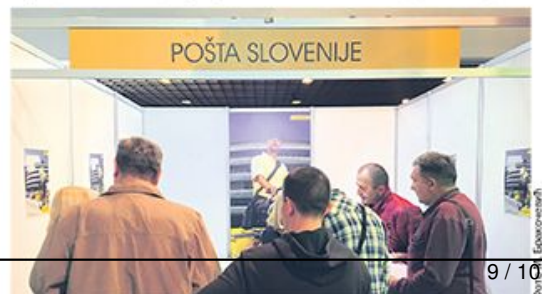
Да ли ће после возача Србија остати и без поштара