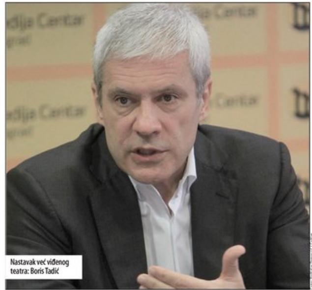
Nastavak već viđenog teatra: Boris Tadić

- Nakon pola decenije upravljanja lažima, Vučiću danas veruju samo lakoverni i oni koji