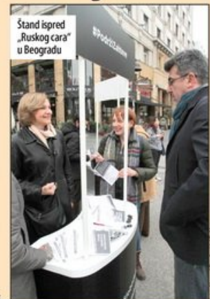
Stand ispred „Ruskog cara“ u Beogradu