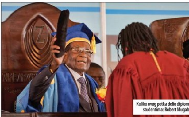
Koliko ovog petka delio diplome studentima: Robert Mugabe

Susreti novinara Danasa sa predsednikom Zimbabvea