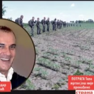
ПОТРАГА Тело жртве још није пронађено