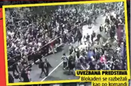
LVEZBANA PREDSTAVA Blokadeni se razbežali kao po komandi

Broj 4312 / 50 dinara / Republika Srpska 1 KM / Crna Gora 1 EUR