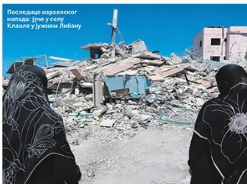
Последње израелског напада: јуче у селу Клаије у јужном Либану