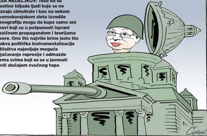
Iz Danasove urednice: Korakovićeva karikatura

■ RAŠA NEDELJKOV: Tezu da su desetine hiljada ljudi koje se ne poznaju simulirale i kao na nekom severnokorejskom sletu izvodile koreografiju mogu da kupe samo oni umovi koji su u potpunosti isprani toksičnom propagandom i teorijama zavere. Ono što najviše brine jeste što ovakva politička instrumentalizacija tužilaštva najavljuje moguće pojačavanje represije i odmazde prema svima koji su se u javnosti bavili slučajem zvučnog topa