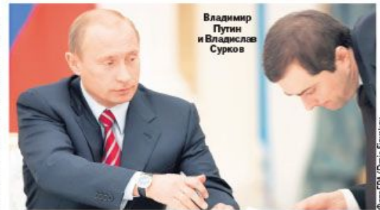
Владимир Путин и Владислав Сурков