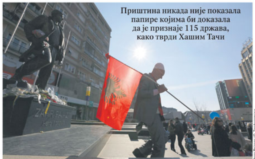
Са прославе десетогодишњице једностраног проглашења независности