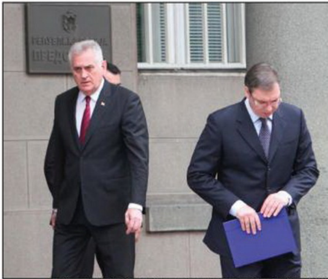
Bitka za nasleđe SNS: Tomislav Nikolić i Aleksandar Vučić posle konsultacija o formiranju Vlade Srbije maja 2016.

Revizija tužbe Bosne i Hercegovine protiv Srbije za genocid novi povod za produbljivanje krize u odnosima dve države