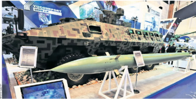
Српска ракета земља-земља изазвала велику пажњу у Абу Дабију

ЕКСКЛУЗИВНО: „ПОЛИТИКА“ НА САЈМУ НАОРУЖАЊА АЈДЕКС 2017