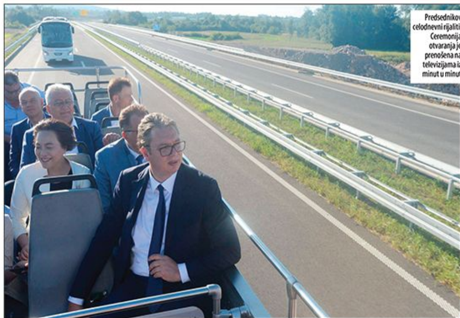
Predsednikov celodnevni rijaliti: Ceremonija otvaranja je prenošena na televizijama iz minut u minut