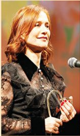
Čuvena francuska glumica Izabel Iper za Danas

Nijedna uloga mi nije teška, ali još uvek imam tremu