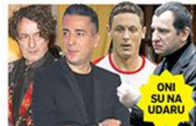
ONI SU NA UDARU