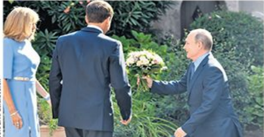
Сусрет француског и руског државника у пријатељској атмосфери: цвеће за прву даму Француске Брижит Макрон