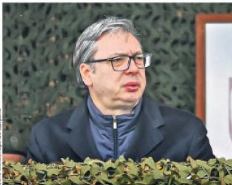
Председник Србије јуче на војној вежби на Пештери

Резолуција о Сребреници у УН је немачка идеја, подржана од најмоћнијих земаља НАТО-а, од САД до свих осталих. Морали су да нађу на сваком континенту неког подржавца, пронашли су Руанду, Нови Зеланд и Чиле и неколико земаља које су одувек биле спонзори таквих пројеката, а то су Малезија и Јордан, рекао је јуче председник Србије Александар Вучић говорећи о предстојећем гласању за резолуцију у УН.