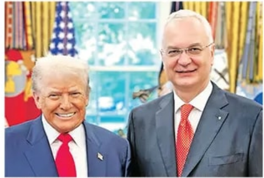
Доналд Трамп и амбасадор наше земље у САД

За Иран је сада и прекид ватре у Либану неодојива тема од споразума о окончању сукоба са Америком