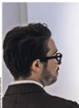
Са изложбе „уметнички“ дела која је креирала ВИ