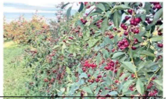
Вишња је ове године богато родила